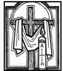
—James Field, Copyright © J. S. Paluch Co.

Now we see the paschal candle as a sign of the great baptismal season of grace and it remains in a prominent place throughout the entire fifty days. We do know of some churches that did not hide the candle after the Ascension. In England before the Reformation, the candle was left in place for fifty days, since on Pentecost Eve there was a vigil, and the candle was used to consecrate the waters of the font. In Salisbury cathedral, the candle was thirty-six feet high, and in Westminster Abbey weighed over three hundred pounds. On Pentecost, the candles were melted to make tapers for the funerals of the poor.