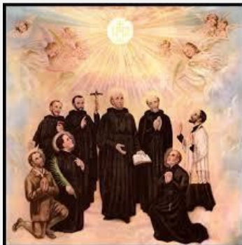
—Peter Scagnelli, Copyright © J. S.

hardships, their steadfast courage in facing unspeakable tortures, and undaunted love even for those who martyred them, bore fruit, immediately in Kateri Tekakwitha's sanctity, eventually in the Catholicism that still flourishes in the United States and Canada.