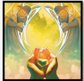
Copyright © J. S. Paluch Co.

Paul opens his letter with essentially the same notion—that in God alone we find our grace and peace. Paul also gives thanks to God on our behalf, calling to mind our work of faith, hope, and love. And in the familiar Gospel reading, Jesus tells the Pharisees to give to Caesar what is Caesar's and to God what is God's.